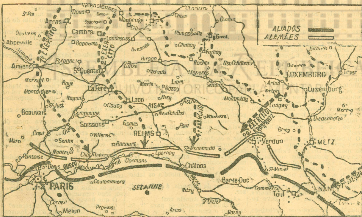
Este mapa indica as posições dos exercitos em luta após a primeira fase das batalhas do Marne que tiveram começo no dia 6. Por ele o leitor do Seculo pode facilmente verificar qual tem sido a marcha dos exercitos alemães e até mesmo qual foi o seu maior avanço, pois que se vêem no mapa indicadas as povoações por onde passava a linha em que as tropas alemãs começaram a ser atacada. Essa linha começava a nordeste de Paris, em Nanteuil, estendia-se por Meaux, Coulommiers, Sezanne e Vitry, d'aqui para nordeste até Verdun, descendo depois para sudoeste até ao sul de Nancy

Se o sr. ministro da guerra entende ser conveniente pôr isto no são e cortar os rãos ao caciquismo — antigo e moderno — deve mandar syndicar do que foi este ano o serviço do apuramento de recrutas em muitos concehos. Se em alguns quizer ordenar a reinspeção dos isentos, ha de obter a immediata confirmação de que predomina hoje, como nos tempos da monarchia, o regimen do compadrio. E tal regimen, em assunto d'esta especie, é uma verdadeira traição aos principios basilares da Democracia